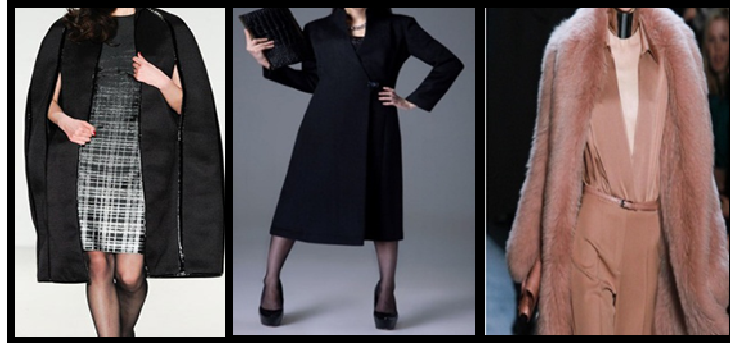
صورة رقم (١٣) نموذج لمعاطف المساء والسهرة

تتمتع معاطف المساء عادةً بالأقمشة الفاخرة فيما ان تكون مطرز أو من قماش حريري أو مخملي يزين بالكريستال أو يكلف من الفرو أو من ريش النعام ويتميز بالأناقة كما في صورة رقم (١٩).