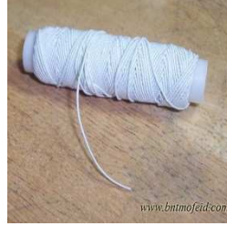
صورة رقم (٦)

شريط مطاطي عريض واخر رفيع يستخدم في ملابس المرأة الحامل