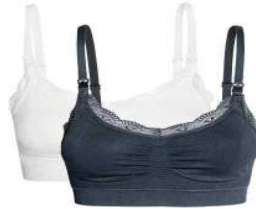
صورة رقم (٧) مشدات حمالات للصدر تستخدمها المرأة أثناء فترة الحمل ( www.nawa3em.com )