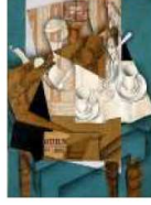
مصدر الاستلهام لوحة الفطور