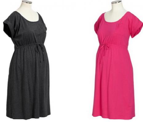
صورة رقم (٣) ملابس خفيفة الوزن للمرأة الحامل مصنوعة من القطن