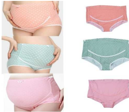
صورة رقم (٩) السروال الداخلي الخاص بالمرأة الحامل

■ السروال الداخلي : يزداد اتساع الوركين بمسافة ٢بوصة، مما يؤدي إلى الحاجة إلى شراء ملابس داخلية جديدة، وتحتاج الحامل إلى استخدام ملابس داخلية جديدة خاصة بالحامل كما في صورة رقم (٩) ، نظراً لأن النمو السريع للبطن سيؤدي إلى أن السراويل الحالية ستصبح ضيقة أكثر من اللازم فلابد من استخدام ملابس خاصة في هذه الفترة . (سوسن رزق، وآخرون ، ٢٠١٣ ، ص٢١٣)