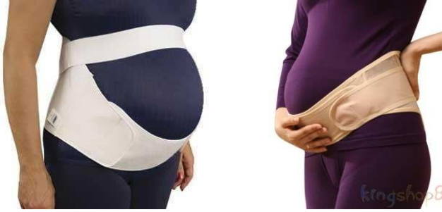
صورة رقم (٨) انواع مختلفة لمشدات البطن للمرأة الحامل ( http://forum.hwaml.com )

■ مشدات البطن (حزام الحمل): إن الغرض من الملابس الداخلية الداعمة الخاصة بمرحلة الحمل هو دعم منطقتي البطن وأسفل الظهر لدى السيدة الحامل دون تقييد تطور نمو الجنين كما في صورة رقم (٨) ، لأن الرحم يصبح أكبر وأثقل بتقدم مراحل الحمل، فيتسبب ذلك في إجهاد وزيادة الضغط على منطقة أسفل البطن، ومنطقة أسفل الظهر بالإضافة إلى منطقة ما بين الفخذين وخاصةً إذا كان الحمل في أكثر من مولود. (سوسن رزق، وآخرون ، ٢٠١٣ ، ص٢١٣)