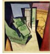
مصدر الاستلهام لوحة طعام الإفطار