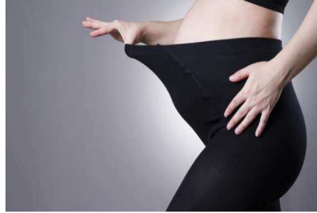
صورة رقم (٤) ملابس مصنوعة من الأقمشة المطاطة للمرأة الحامل