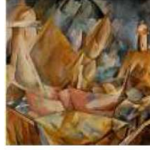
مصدر الاستلهام لوحة ميناء في نور ماندي (١٩٠٩) جورج براك (most-famous-paintings.com)