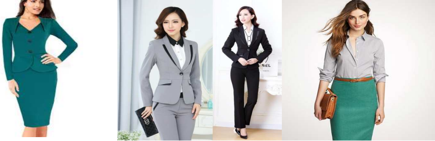
صورة رقم (١١) نموذج لزي يرتدى في الحفلات الرسمية